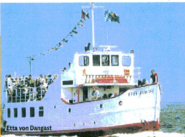
Etta von Dangast

Die gemütliche Stadt Varel mit kleinen Geschäften und Cafés in der Innenstadt ist der Zielort für ein rundum tolles Wochenende am Jadebusen. Romantik gibt es am Hafen, wo Fischkutter und hochseetüchtige Yachten am Kai dümpeln. In der Erlebnistagstätte „Tante Emma“ dagegen ist Stimmung angesagt.